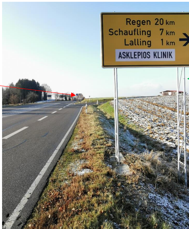
Bestehende Beschilderung bei der B533-Abfahrt Lalling, von Hengersberg kommend

Möglicher neuer Platz für ein größeres Schild